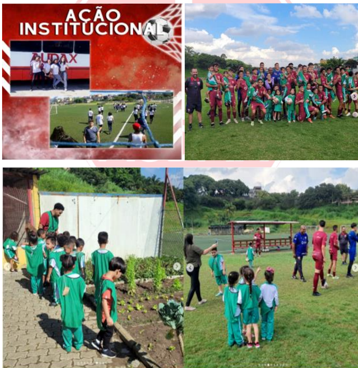
Fotos de crianças da rede municipal visitando o Centro de Treinamento

O Grêmio Osasco Audax sempre procurou inserir a comunidade local em suas atividades de rotinas, nesse sentido, desenvolveu o programa Clube Aberto a Comunidade, que recebe por meio de visitas organizadas e agendadas outras organizações, escolas entre outros entes que queiram visitar o Centro de Treinamento e todas as instalações disponíveis.