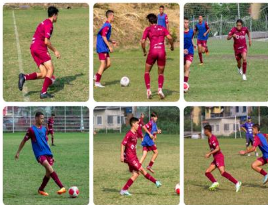
Categoria - Sub15

Os atletas recebem orientação técnica e tática com equipe multiprofissional, composta de Técnico de Futebol, Preparador Físico, Preparador de Goleiro, além de orientação com Médico do Esporte, Fisioterapeuta, Assistente Social, e Nutricionista Esportiva, além de equipe de apoio e toda infraestrutura dentro do CT.