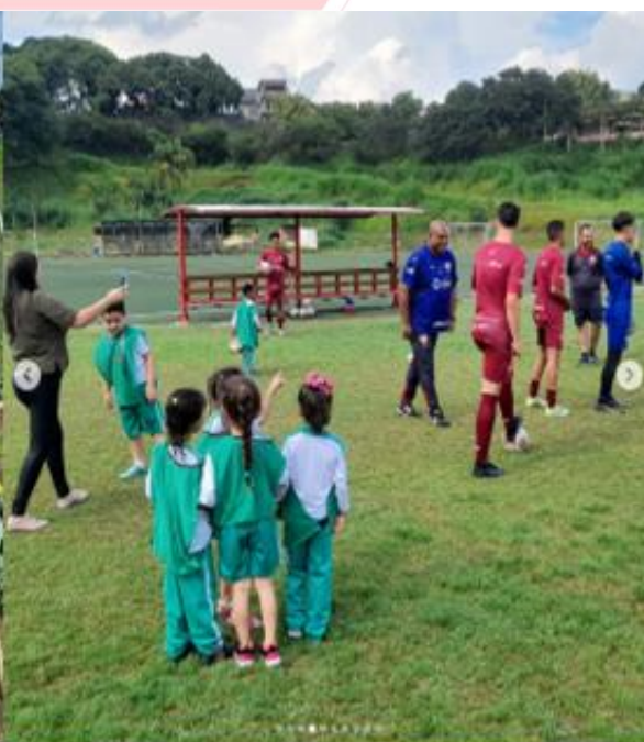
Fotos de crianças da rede municipal visitando o Centro de Treinamento