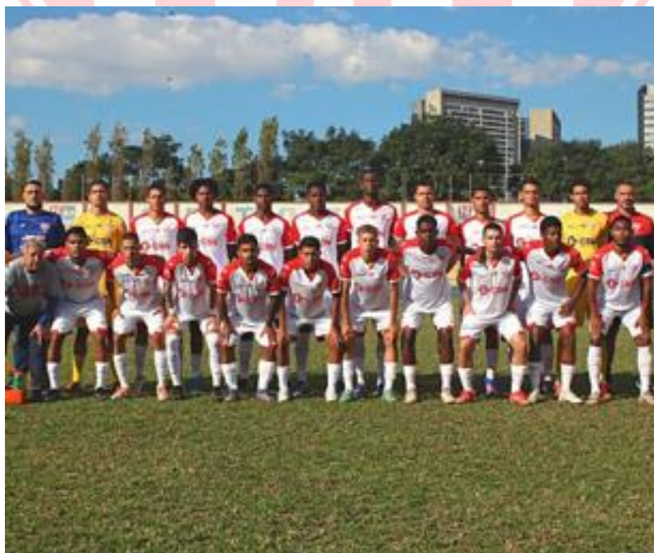
A equipe Sub20 – disputou a Paulista CUP e chegou até as Oitavas de Finais.

De igual forma todos os atletas do Audax são beneficiados e atendidos por equipe Multiprofissional composta de Técnico de Futebol, Preparador Físico, Preparador de Goleiro, além de orientação com Médico do Esporte, Fisioterapeuta, Assistente Social, Psicólogo Esportivo e Nutricionista Esportiva, além de equipe de apoio e toda infraestrutura dentro do CT.