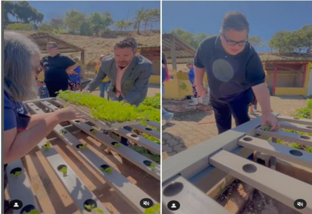
Fotos da Estrutura da Horta Terapia Ativo e da Oficina Formativa para os colaboradores e diretores do Audax, realizado em parceria com o Instituto Carisma.