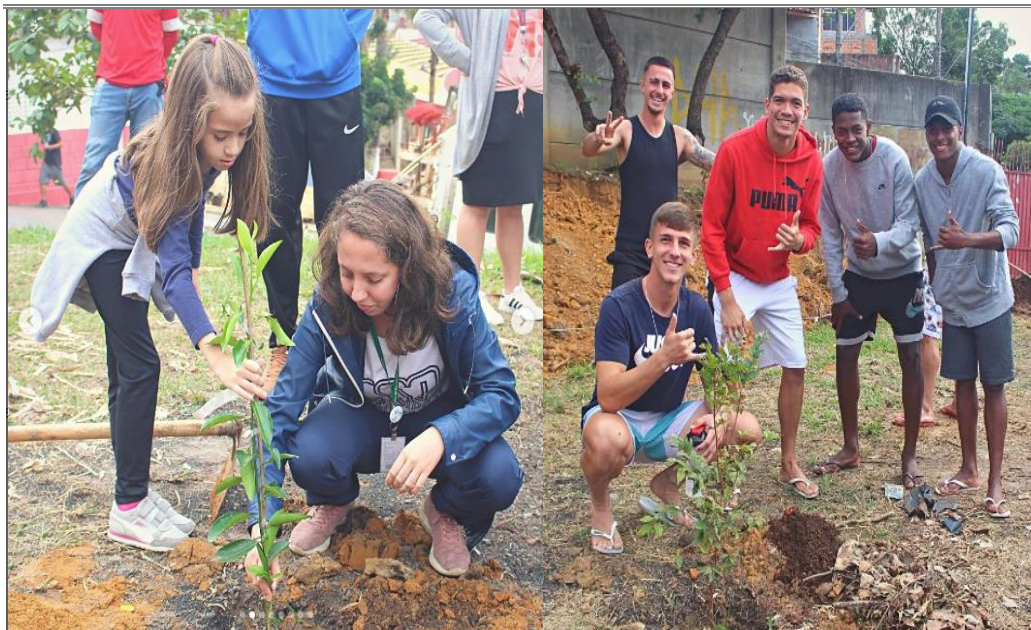
Imagens da participação de familiares e atletas no evento