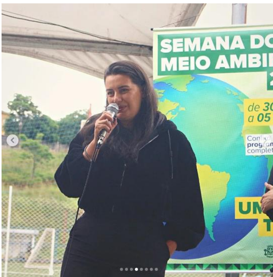
Imagem da representante do Clube na abertura do evento

Durante a semana de comemoração do MEIO AMBIENTE em 2022, a Secretaria Municipal de Meio Ambiente e Recursos Hídricos da Osasco, promoveu o plantio de 57 mudas frutíferas em uma área denominada de Pomar Educacional Mario Texeira no Centro de Treinamento da Vila Yolanda, a atividade foi desenvolvida pela diretoria, atletas, colaboradores, familiares e convidados. A atividade fez parte do calendário da semana do meio ambiente promovida pela cidade.