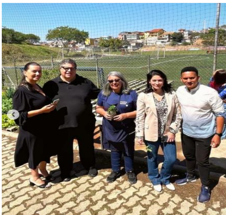
Imagem da Diretoria do Audax na inauguração da Horta Hidropônica