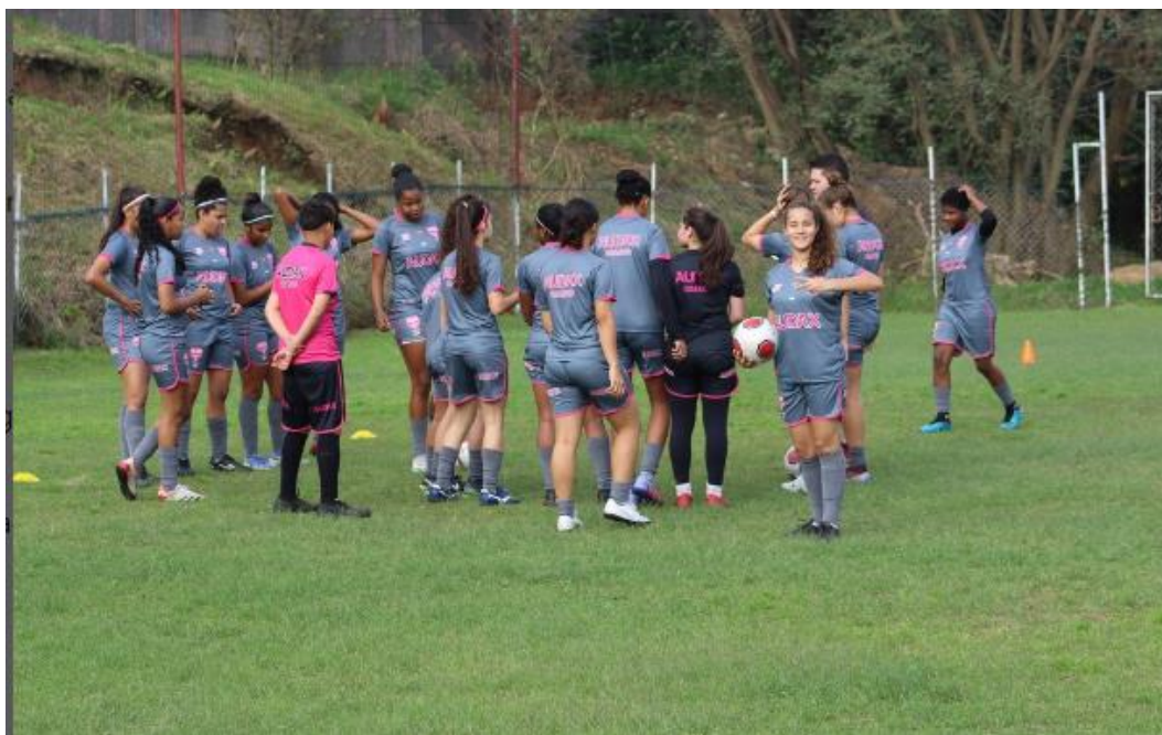
Foto de treino da categoria sub15, no Centro de Treinamento do Audax

A equipe da categoria sub15 feminino, foi eliminada na primeira fase do campeonato.