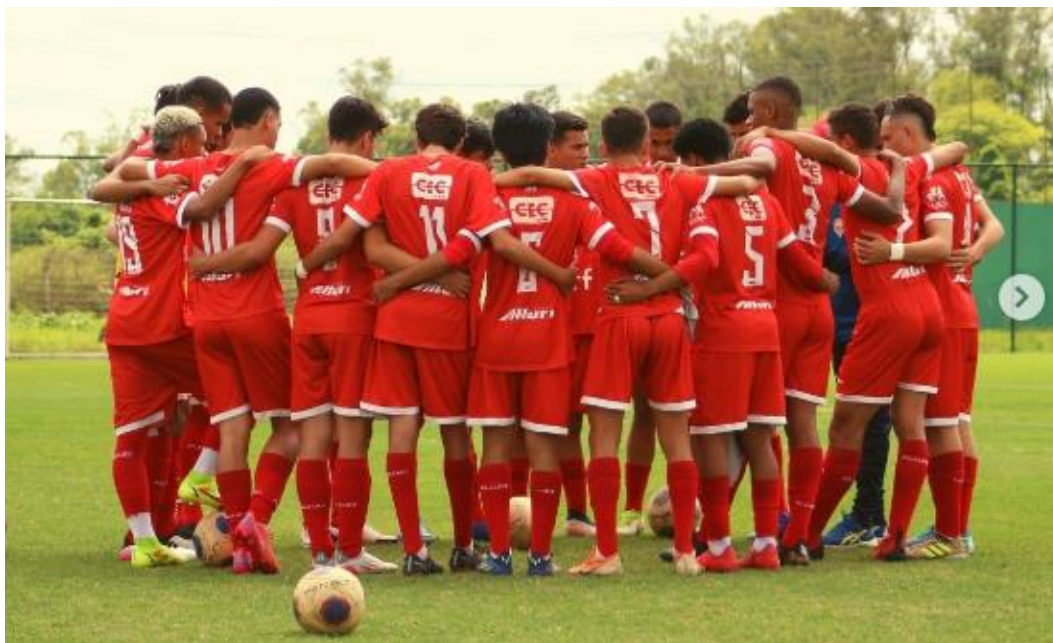
Imagem de treino da categoria Sub15.