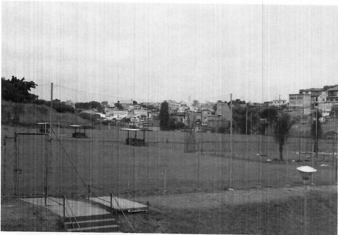
Foto do campo onde os atletas treinam

Meta 3: Garantir que os atletas integrantes do projeto, com idade entre 15 e 17 anos, estejam em ambiente saudável e com orientação adequada a prática esportiva, em horário contra turno escolar (para os que apresentam idade para frequentar os ensinamentos fundamentais e médio, e que ainda não o concluíram). Através do nosso trabalho Socio-assistente e do Psicologia, os atletas foram encaminhados às escolas próximas do Centro de Treinamento em sistema de convênio (Escola x Clube). Foi firmado também um convênio com uma instituição particular de ensino para os atletas do primeiro grau, escola essa de excelente qualidade.