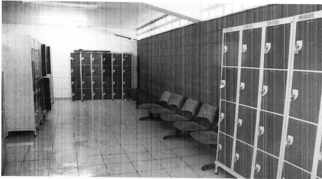
Foto do vestiarios dos atletas